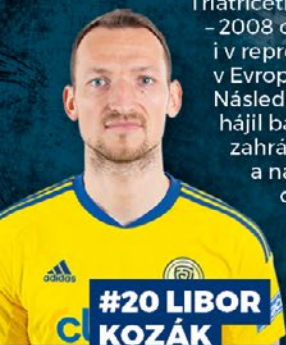
#20 LIBOR KOZÁK

Třiatřicetiletý útočník z Opavy. Za Opavu mezi lety 2006 – 2008 odehrál 41 zápasů a nasázel 19 gólů. Nastupoval i v reprezentacích do 19 a 21 let. Jeho výkonů si všimli v Evropě a v roce 2008 přestoupil do Lazia Řím. Následně hrál i v Brescii a od roku 2013 do roku 2017 hájil barvy Aston Villy. Poté se vrátil do Itálie, kde si zahrál za Bari a Livorno. V české lize odehrál 69 utkání a nasázel v nich 26 branek. Nastoupil také do devíti utkání české reprezentace a vstřelil dva góly. Vyhral dvakrát italský pohár s Laziem. Ovládl také český pohár se Spartou. V sezoně 2012/13 byl nejlepším střelcem Evropské ligy a v sezoně 2019/20 nejlepším střelcem české ligy. Díky své výšce 192 cm je skvělým hlavičkářem.