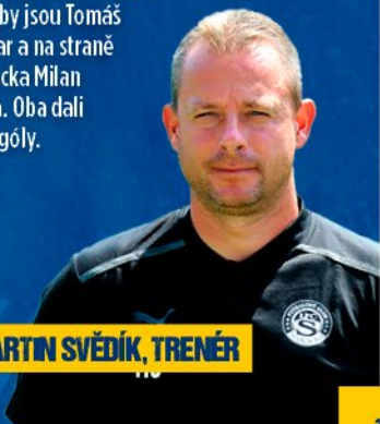
MARTIN SVĚDÍK, TRENÉR

Dnešní utkání bude 24. ligovým derby a bilance je naprosto vyrovnaná. Devět utkání vyhráli jak ševci, tak i jejich rival. Pět duelů skončilo remízou. V zápasech padlo celkem 56 gólů. Rozhodčí tasili 109 žlutých karet a tři červené. Nejčastější výsledek je 2 : 1, skončilo jím pět utkání. Poslední derby hrané na Letné dopadlo prohrou Zlína 1 : 2. Nejlepšími střelci v derby jsou Tomáš Poznar a na straně Slovácka Milan Ivana. Oba dali čtyři góly.