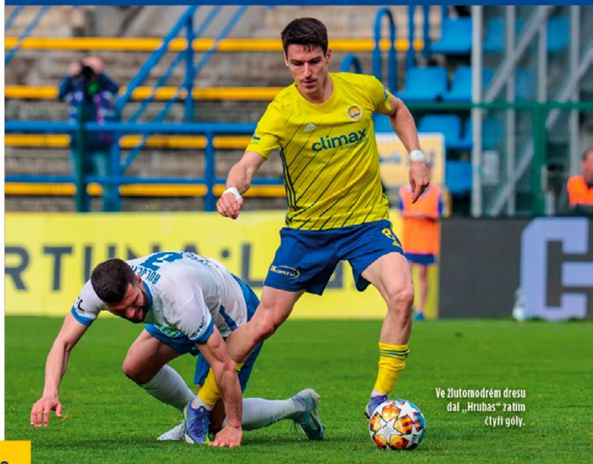
Ve žlutomodrém dresu dal „Hrubas“ zatím čtyři góly.

Samozřejmě bych chtěl, aby jich bylo víc, ale já jsem gólů nikdy moc nedával. Mám i nějaké asistence, takže dohromady se blížím té padesátce. Je škoda, že v těch mladistvých letech jsem nebyl tak otrkaný a bál jsem se brát zodpovědnost tolik na sebe, i když si myslím, že jsem na to měl. Mnohokrát jsem ale říkal, že je